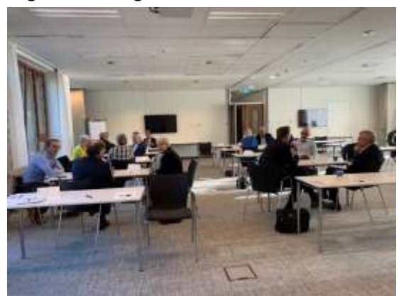
Tijdens de bijeenkomst was er gelegenheid om kennis en ervaring te delen.

Daarna was er een presentatie van Jaap Kamphorst over de ontwikkeling van de governance in de laatste decennia en gebruikte de zorg als referentiegroep. Er waren meer dan 40 deelnemers van 15 verschillende organisaties aanwezig. Er was een hoge betrokkenheid en nieuwsgierigheid van de deelnemers aan het gesprek. Uit de evaluatie bleek dat de bijeenkomst gewaardeerd werd met een 8,5. Er werden nieuwe contacten gelegd en inzichten aangescherpt. Deelnemers hebben het ervaren als een verrijking om geïnformeerd te worden hoe andere Raden van Toezicht functioneren.