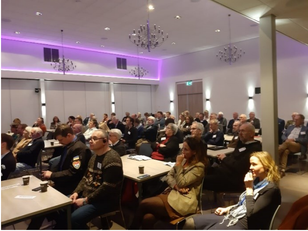
Oekraïne-symposium te Nijkerk