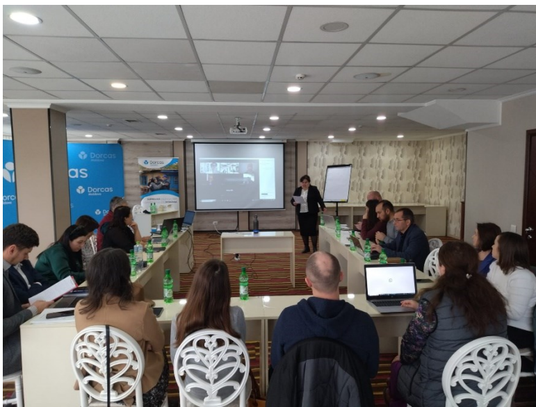
Ceremonie rond uitreiken LRM-certificaten (Moldavië, Roemenië) te Chisinau, Moldavië.