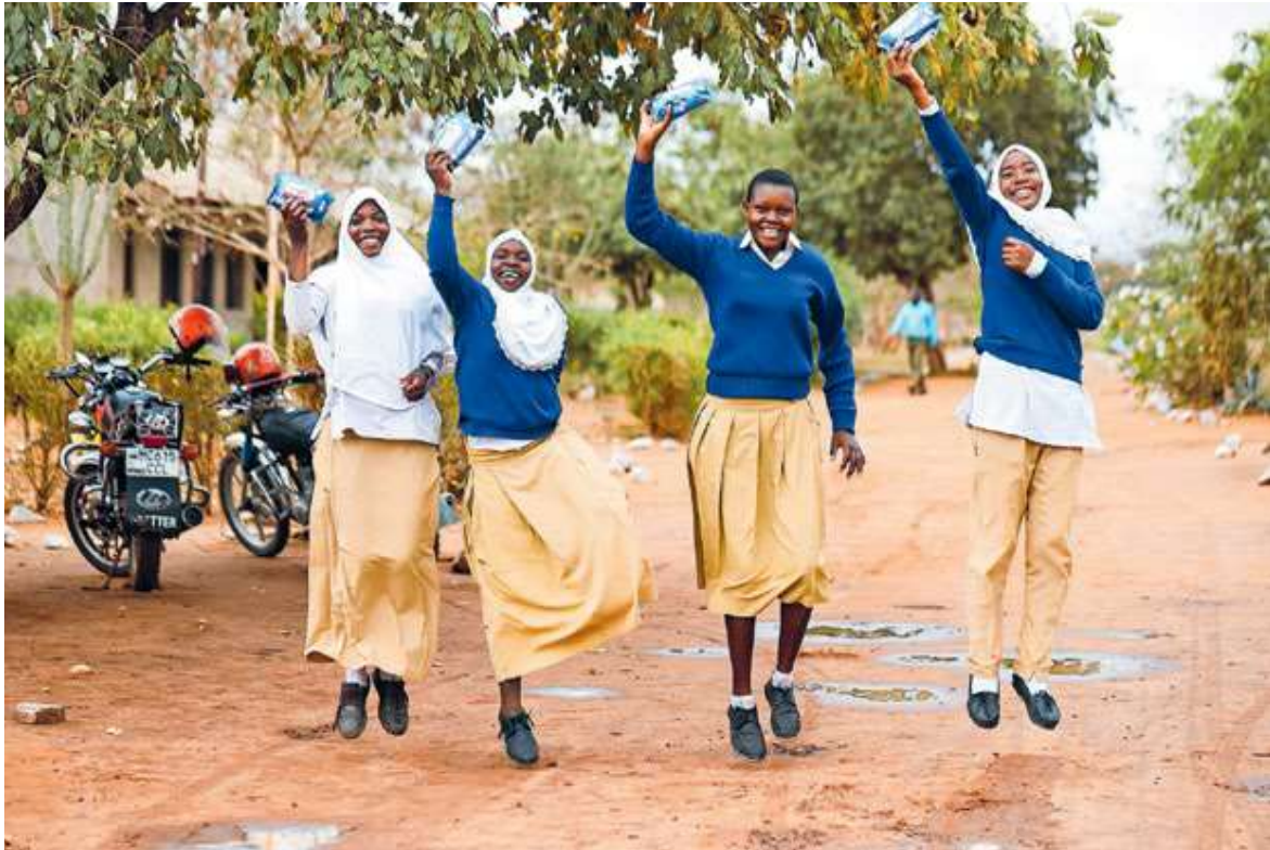
MENSTRUATIEHYGIËNE IS INMIDDELS EEN VAST ONDERDEEL VAN HET SCHOOLCURRICULUM IN TANZANIA.