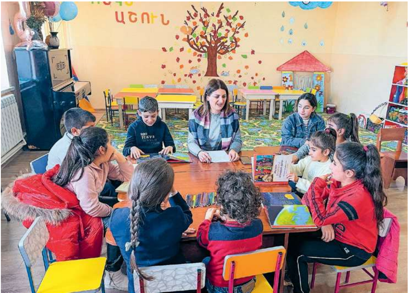
KINDEREN UIT NAGORNO-KARABACH WORDEN CREATIEF UITGEDAAGD OM HUN TRAUMA'S TE VERWERKEN.

niet sprak en niet speelde. Niet met een vriendinnetje, niet met speelgoed. Het meisje mocht een "buddy" maken. Een zelf geknutselde pop aan wie ze alles kan en mag vertellen. Dit meisje nam haar buddy mee naar huis en begon ertegen te praten, ermee te spelen en te slapen. Het begin van een mooie verandering. Dit kind had vreselijke dingen meegemaakt waardoor ze het contact met de buitenwereld had verloren. In ons programma leerde ze – samen met haar ouders – de symptomen van stress, angst en verdriet herkennen en bloeide ze langzaam op.'